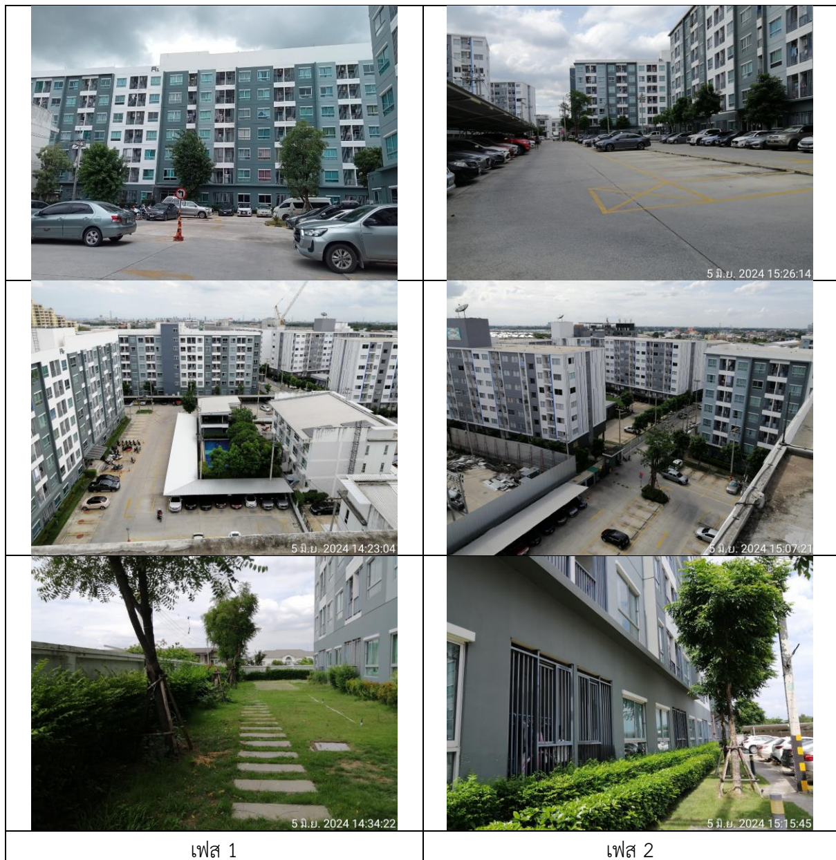
รูปที่ 1-4 สภาพแวดล้อมโดยทั่วไปโดยรอบโครงการ 5 มิถุนายน 2567